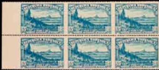
343 - 90 €