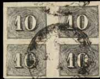
886 - 50 €