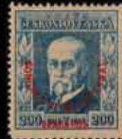
893 - 30 €