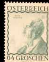
846 - 35 €