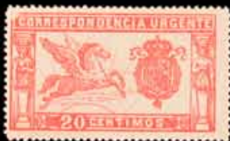
191 - 50 €