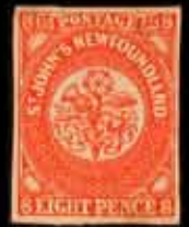
888 - 75 €