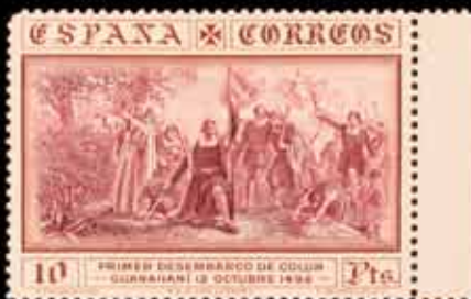
256 - 80 €