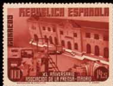
317 - 30 €