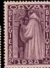
878 - 60 €