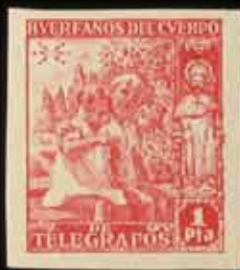
550 - 75 €