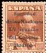
243 - 80 €