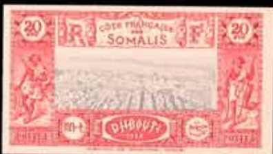
979 - 30 €