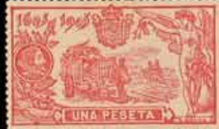
196 - 50 €