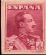
215 - 35 €