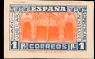
400 - 45 €