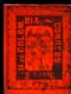
907 - 65 €