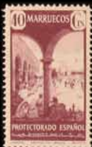
598 - 35 €