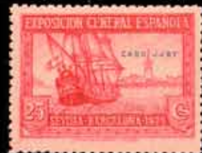
566 - 45 €