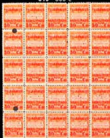
531 - 60 €