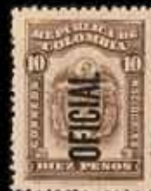
909 - 75 €