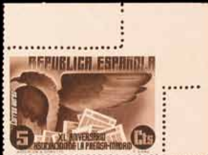
318 - 30 €