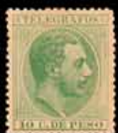
576 - 35 €