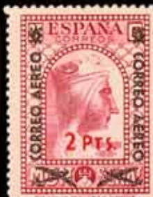
372 - 50 €