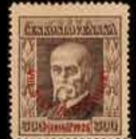
894 - 25 €