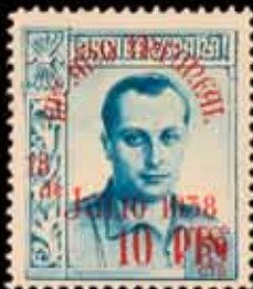
545 - 80 €