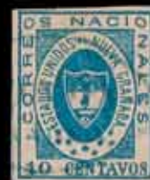
903 - 90 €