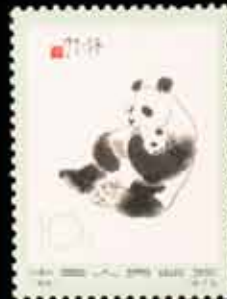
902 - 60 €