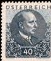
834 - 35 €