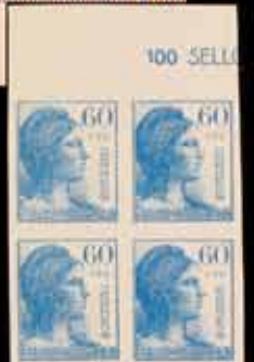
336 - 50 €