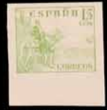
394 - 30 €