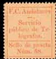
554 - 80 €