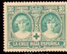
220 - 90 €