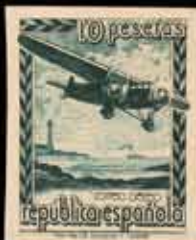
380 - 35 €