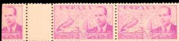
454 - 45 €