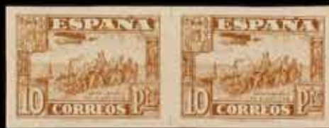
388 - 75 €