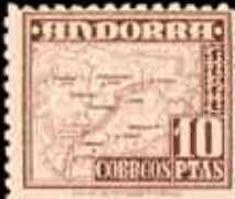
559 - 40 €