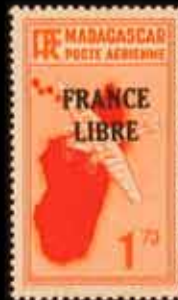
993 - 35 €