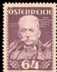
847 - 40 €