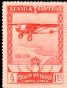
240 - 60 €