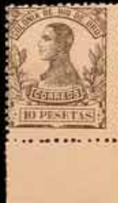
609 - 50 €