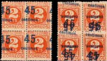
329 - 30 €