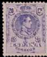
203 - 90 €