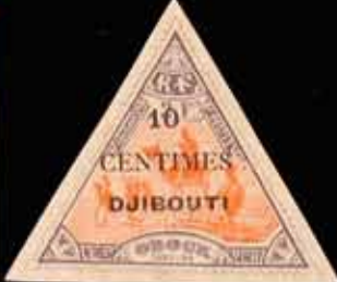
972 - 50 €