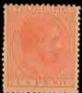
577 - 75 €