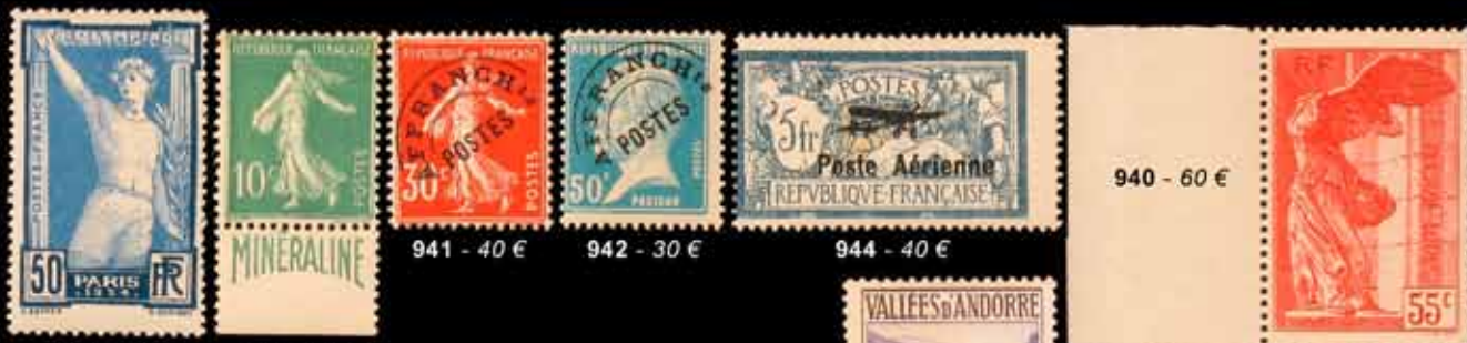
933 - 20 €