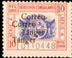
673 - 40 €