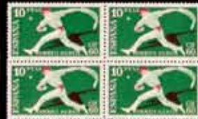
492 - 25 €