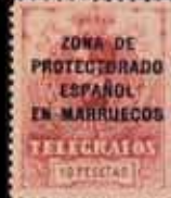
600 - 55 €