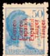
632 - 90 €