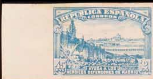
344 - 75 €