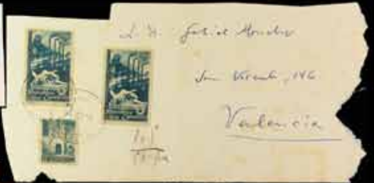
361 - 40 €