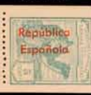
612 - 40 €