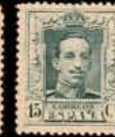
217 - 30 €