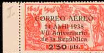
340 - 80 €