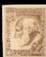
311 - 30 €