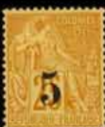
957 - 40 €