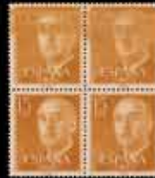
487 - 40 €