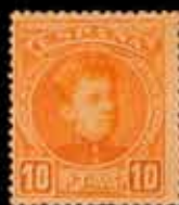
189 - 40 €