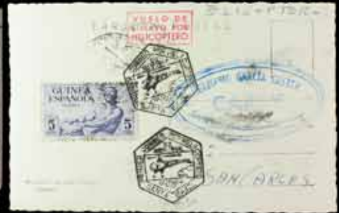
587 - 50 €