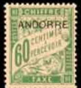
955 - 40 €