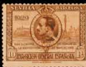
237 - 50 €