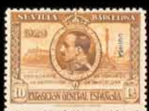
579 - 50 €