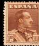
216 - 90 €