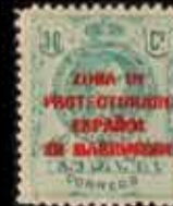
591 - 30 €