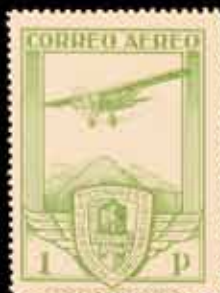
246 - 90 €