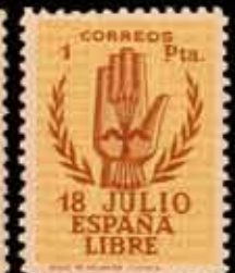
422 - 40 €