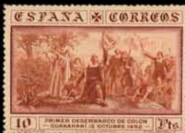
255 - 60 €