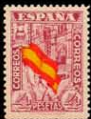
385 - 80 €