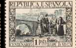
316 - 60 €