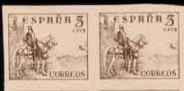
391 - 60 €