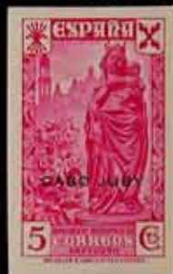
569 - 90 €