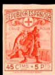
358 - 65 €