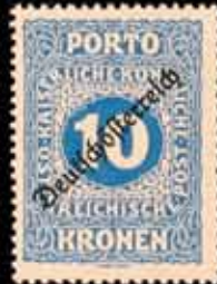
860 - 25 €