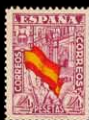
387 - 40 €