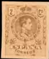
202 - 60 €