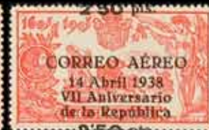
341 - 90 €