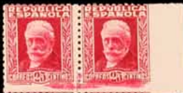
303 - 55 €