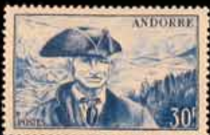
951 - 40 €