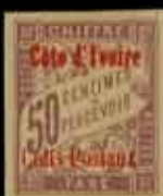
965 - 80 €