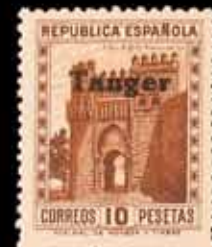
645 - 50 €