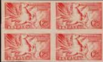
435 - 40 €