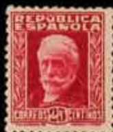
300 - 30 €