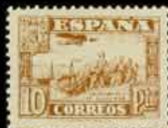
386 - 60 €