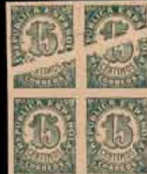
333 - 45 €