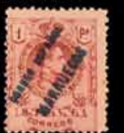
618 - 40 €