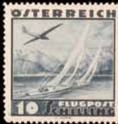
856 - 40 €