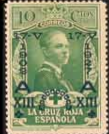
224 - 75 €