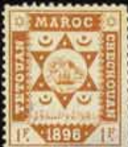
602 - 65 €