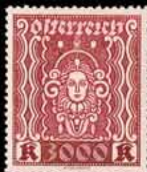
832 - 60 €