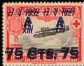
233 - 40 €