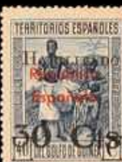
582 - 60 €