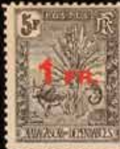
992 - 35 €