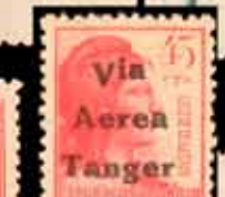
665 - 60 €