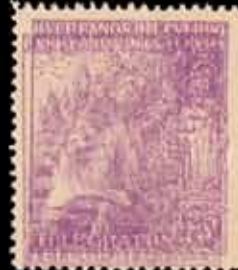
551 - 75 €