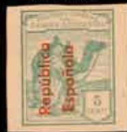
611 - 30 €