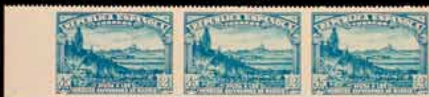
342 - 50 €