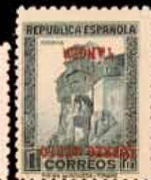
640 - 25 €