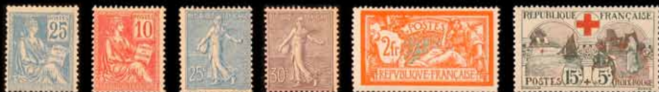
925 - 80 €