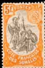
977 - 90 €