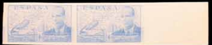
456 - 20 €