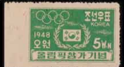
912 - 60 €