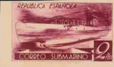
367 - 20 €