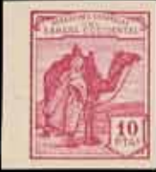
615 - 60 €