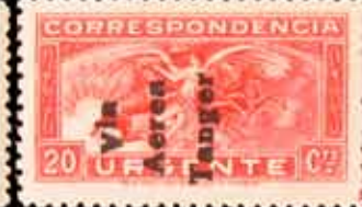
663 - 40 €