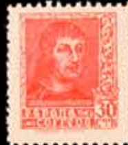
405 - 45 €