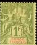
962 - 80 €