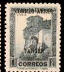
638 - 50 €