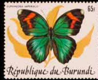
887 - 30 €