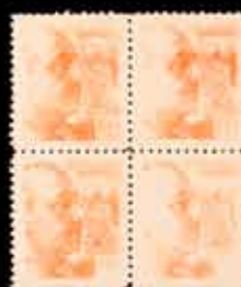
434 - 60 €