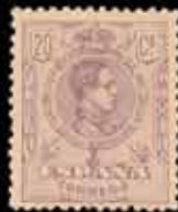
206 - 80 €