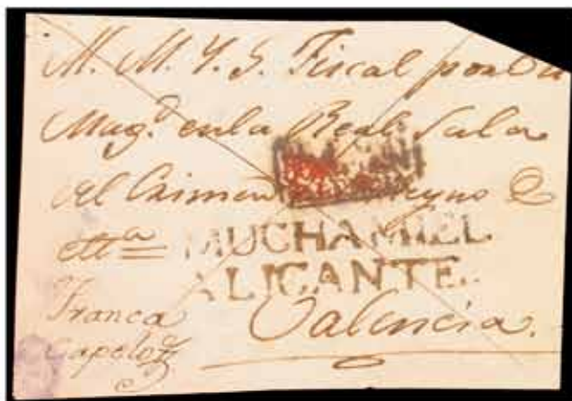
38 - 200€