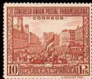
286 - 50 €