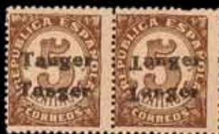
652 - 25 €