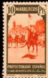
596 - 30 €