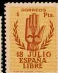
421 - 75 €