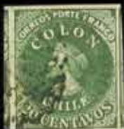
896 - 50 €