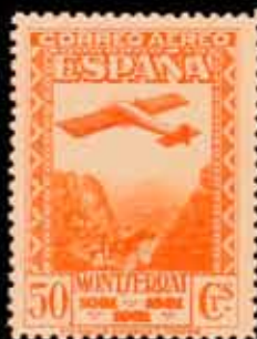
293 - 90 €