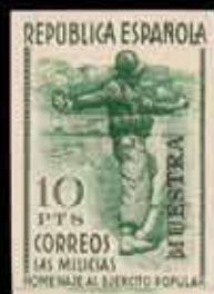
377 - 55 €