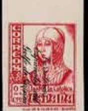
584 - 70 €