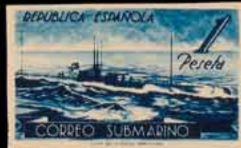
366 - 35 €