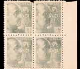
453 - 40 €