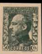
585 - 30 €