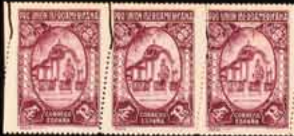
270 - 90 €