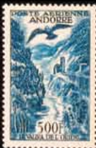
954 - 50 €