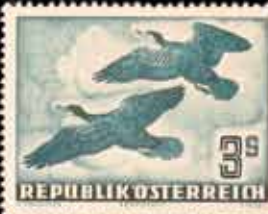
857 - 80 €