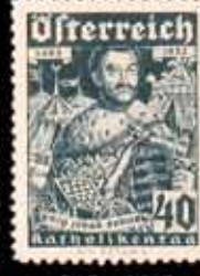
845 - 90 €