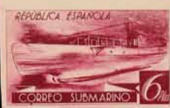
369 - 20 €