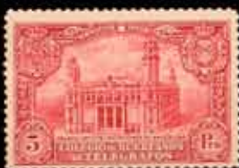
549 - 75 €