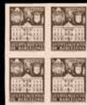
525 - 75 €