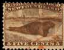
891 - 50 €