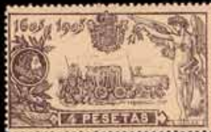
198 - 50 €