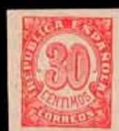
331 - 20 €