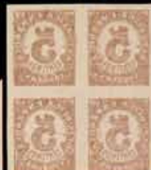
332 - 50 €