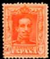
214 - 40 €