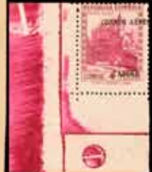
639 - 50 €