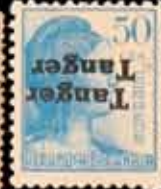
649 - 50 €