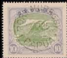
827 - 50 €