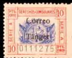
676 - 90 €