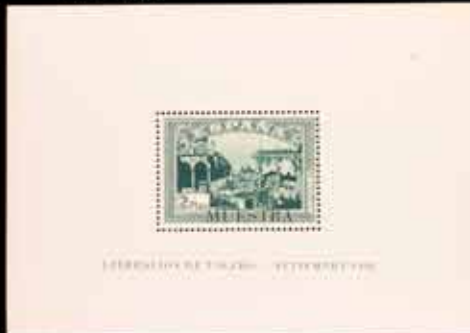
402 - 30 €