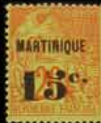
995 - 35 €