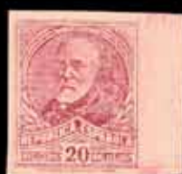
302 - 55 €