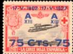
230 - 80 €