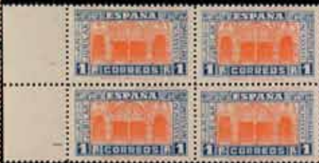
398 - 80 €