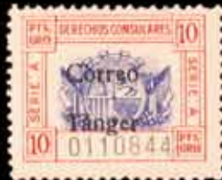
672 - 65 €