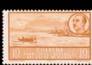
586 - 40 €