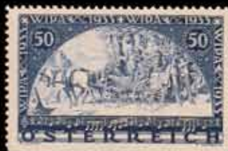
843 - 45 €