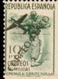
378 - 35 €