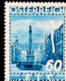
848 - 40 €