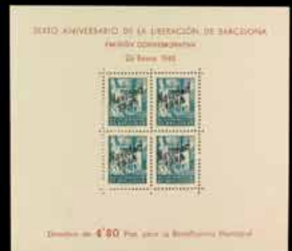
529 - 75 €