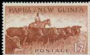
829 - 50 €