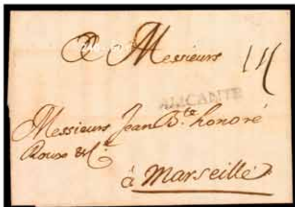
2 - 350€