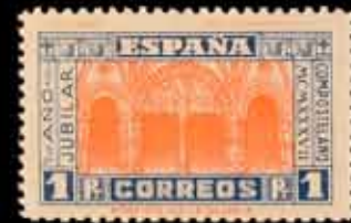
397 - 30 €