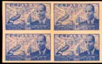
455 - 55 €