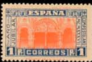
396 - 45 €