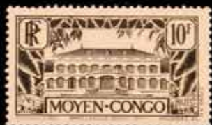
963 - 40 €