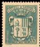
949 - 40 €