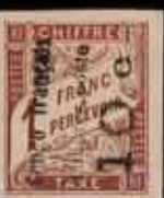
961 - 40 €