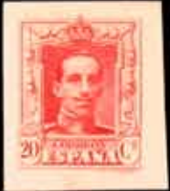
211 - 80 €