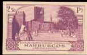
595 - 75 €