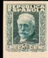
307 - 35 €