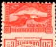
558 - 70 €