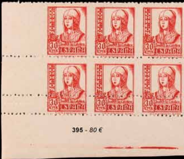
395 - 80 €