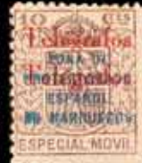
601 - 50 €