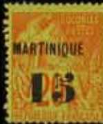
994 - 45 €