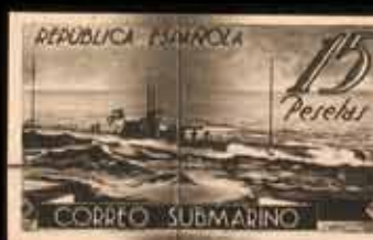
364 - 40 €