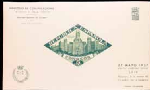
543 - 45 €