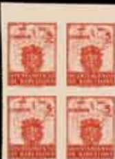
527 - 75 €