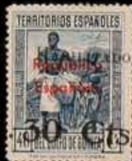
580 - 45 €