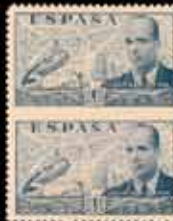
441 - 45 €