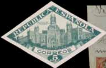
544 - 35 €