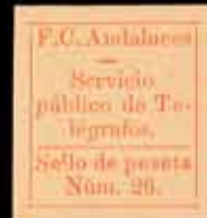
553 - 50 €