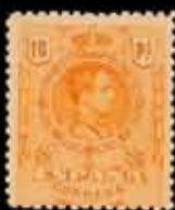
205 - 50 €