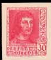
409 - 55 €