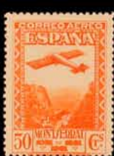
294 - 50 €