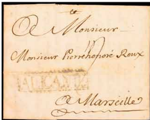
3 - 350€