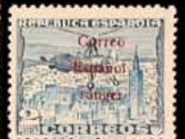
629 - 40 €