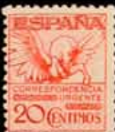
309 - 60 €