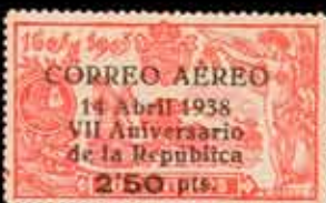
339 - 75 €