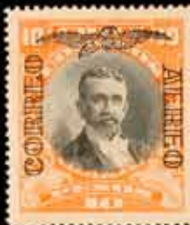
898 - 60 €