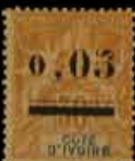
964 - 50 €