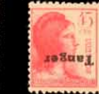
648 - 30 €