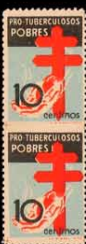
404 - 30 €