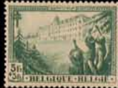
879 - 60 €