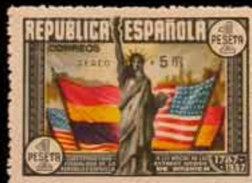
353 - 60 €