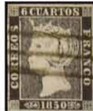
52 - 300€