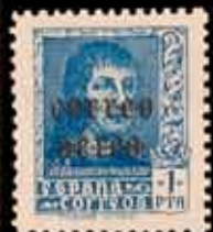
416 - 90 €