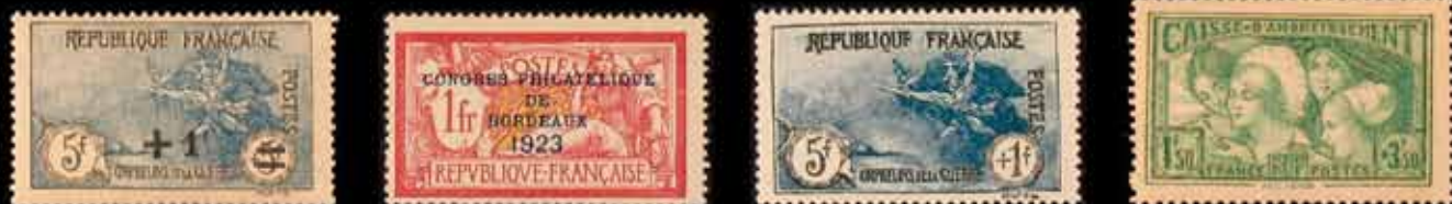
931 - 30 €