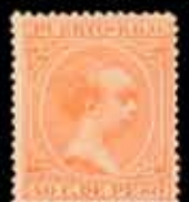
603 - 50 €