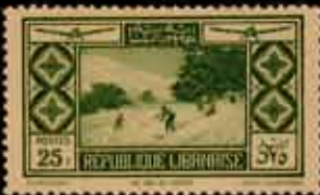
983 - 40 €