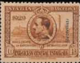
573 - 40 €