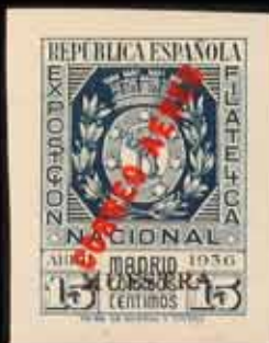
325 - 90 €