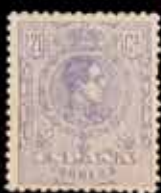
207 - 30 €