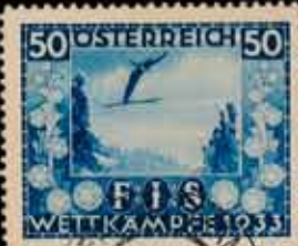
841 - 75 €