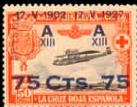
232 - 45 €