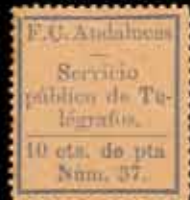
556 - 15 €