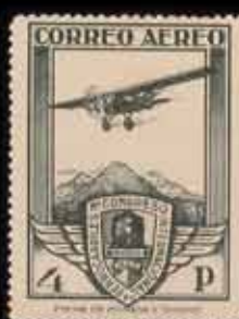
248 - 30 €