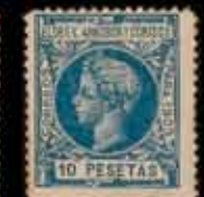
570 - 50 €