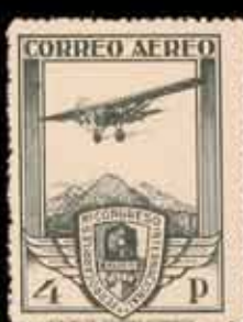
247 - 45 €