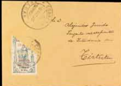
593 - 75 €