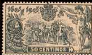
195 - 60 €