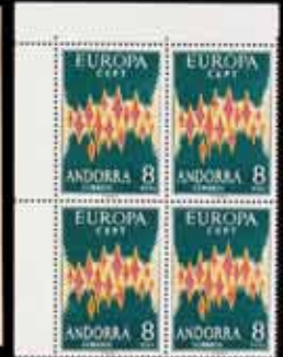
561 - 80 €