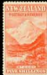
826 - 60 €