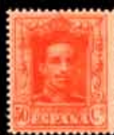
213 - 50 €