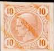
854 - 50 €