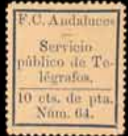
555 - 50 €