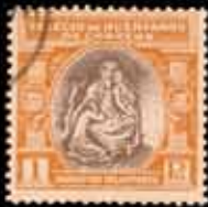
541 - 45 €