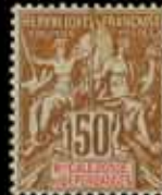
999 - 50 €