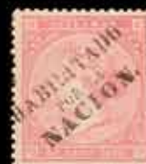
564 - 30 €