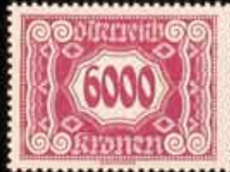
861 - 20 €