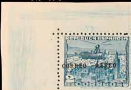
643 - 50 €