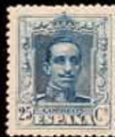
218 - 90 €