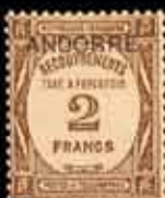
956 - 90 €