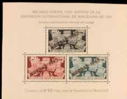
530 - 60 €