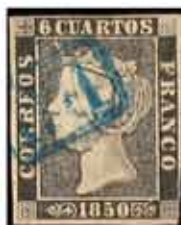
51 - 240€