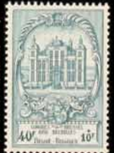
880 - 60 €