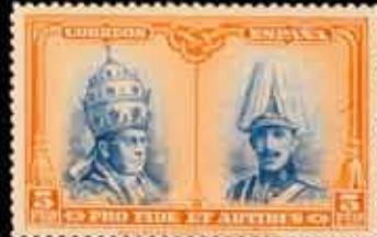
235 - 50 €