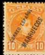
590 - 65 €