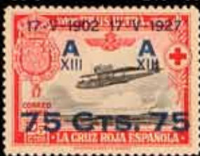
229 - 75 €