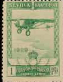
239 - 40 €