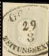
853 - 60 €