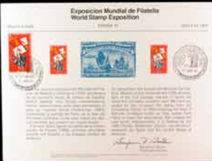
495 - 40 €