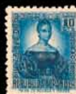
314 - 60 €