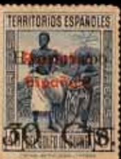
581 - 75 €