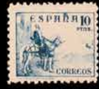
390 - 60 €