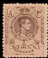
204 - 50 €