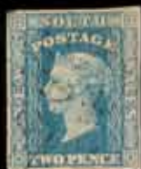
820 - 80 €