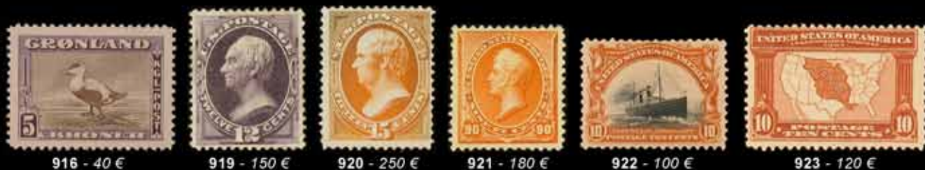
916 - 40 €