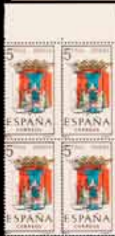
493 - 50 €