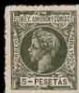
571 - 75 €