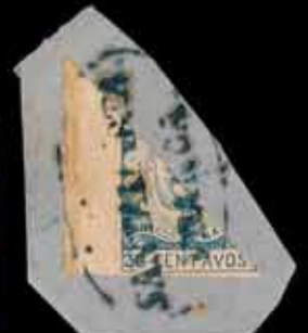
906 - 50 €