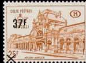
881 - 75 €