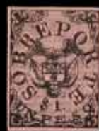
910 - 90 €