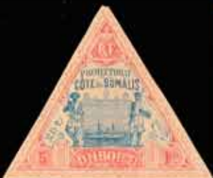
969 - 60 €