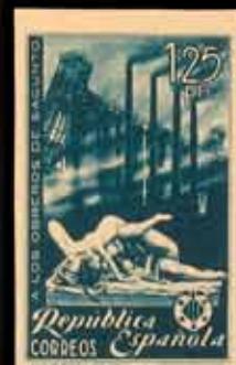
359 - 45 €