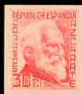
315 - 40 €