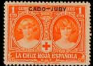
565 - 30 €