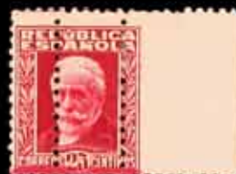
304 - 55 €