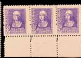
425 - 30 €