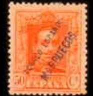
626 - 50 €