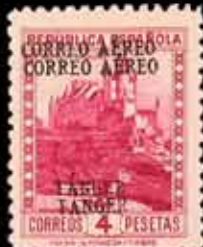
641 - 50 €