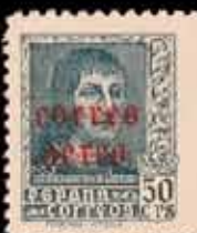
414 - 40 €