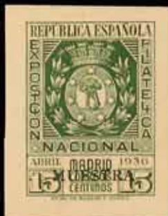
322 - 25 €