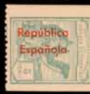
612 - 40 €