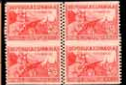
375 - 55 €