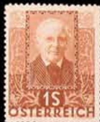
836 - 45 €