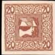
859 - 20 €