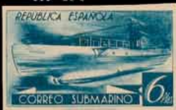
368 - 25 €