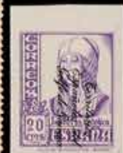
583 - 65 €