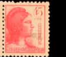
648 - 30 €