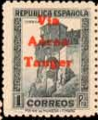
661 - 40 €