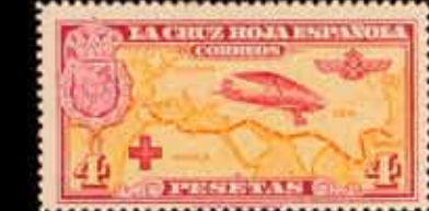
222 - 75 €