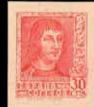
406 - 55 €