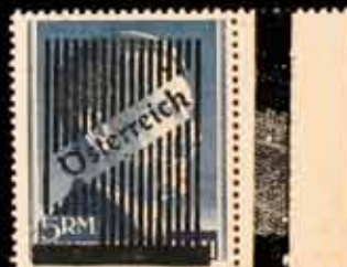
850 - 70 €