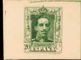
212 - 90 €