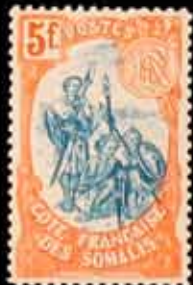
976 - 75 €