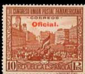
288 - 30 €