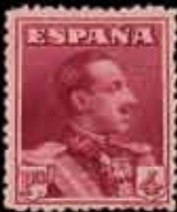
210 - 75 €