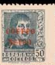
415 - 65 €