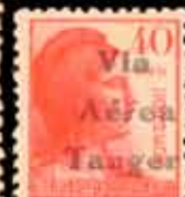
664 - 50 €