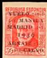
326 - 50 €