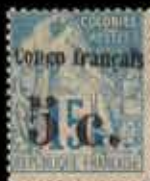
959 - 80 €