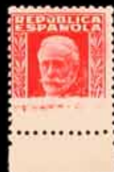
306 - 55 €