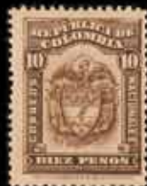
908 - 50 €