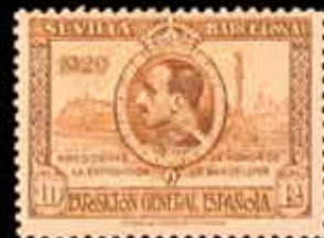
236 - 90 €