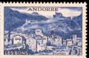
952 - 50 €