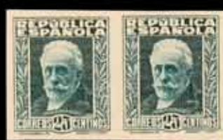
305 - 80 €