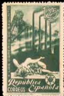
360 - 25 €