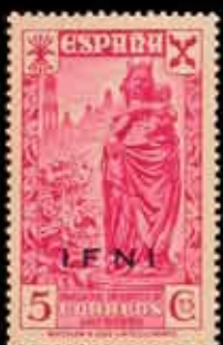
589 - 25 €