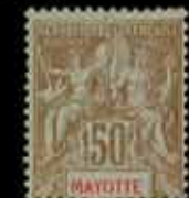
997 - 75 €