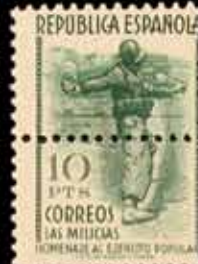
379 - 30 €