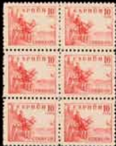
393 - 40 €