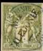
998 - 60 €