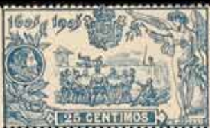
194 - 45 €