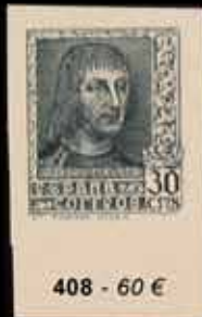
408 - 60 €