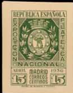
320 - 40 €