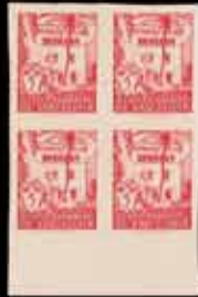
528 - 75 €