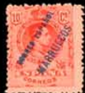
620 - 50 €