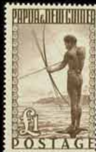
828 - 60 €