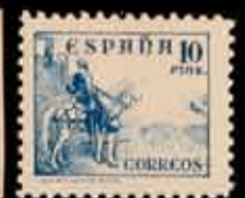
389 - 80 €