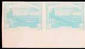
345 - 50 €