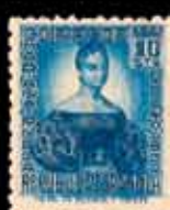
313 - 60 €