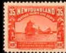
892 - 90 €