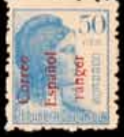
632 - 90 €