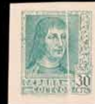
407 - 60 €