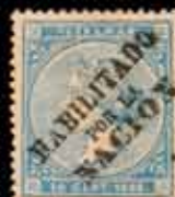
563 - 30 €