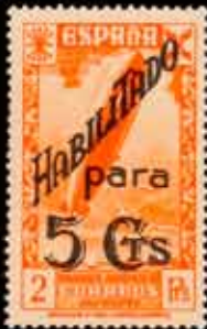
548 - 25 €