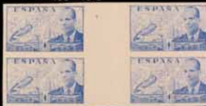
440 - 60 €