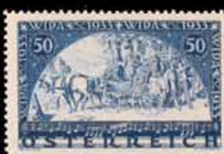
842 - 70 €