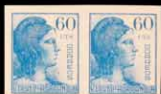
335 - 25 €