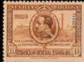
627 - 50 €