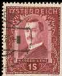
839 - 50 €