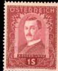
838 - 75 €