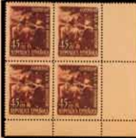
374 - 80 €