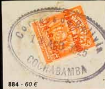
884 - 60 €