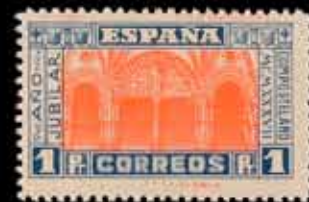
399 - 25 €