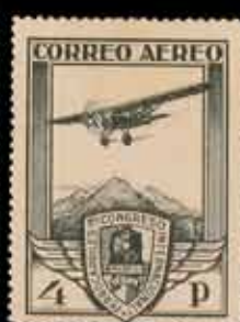
249 - 30 €