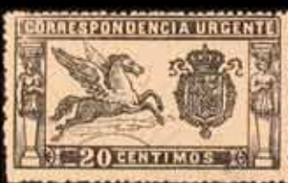
192 - 30 €