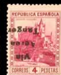
662 - 25 €