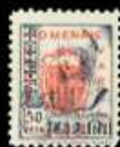
504 - 75 €