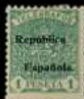
514 - 60 €