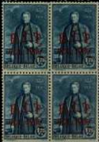
785 - 60 €