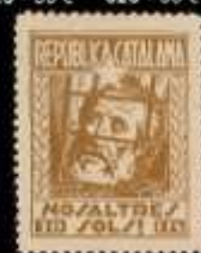
643 - 75 €