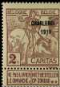
765 - 90 €