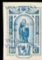
621 - 50 €