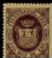
513 - 60 €