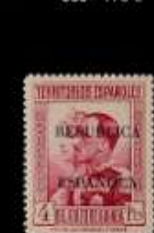
686 - 60 €