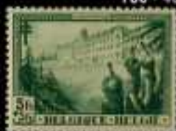
798 - 60 €