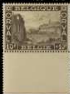
774 - 65 €