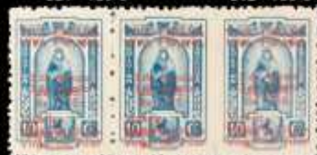
623 - 20 €