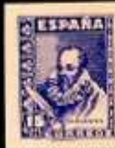
525 - 30 €