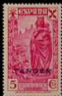
736 - 30 €