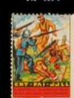
635 - 70 €