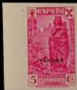
735 - 40 €