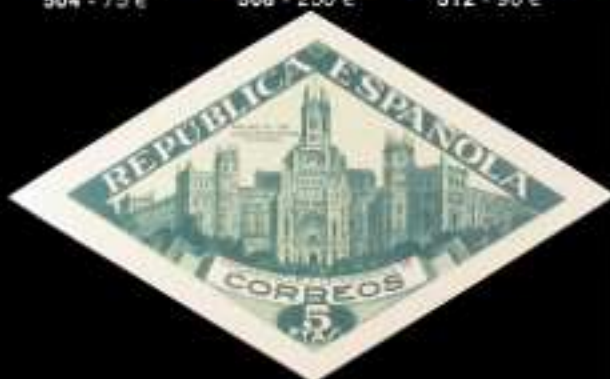
517 - 75 €