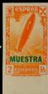
518 - 90 €