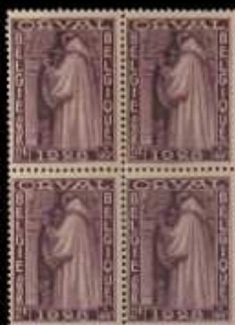
776 - 60 €