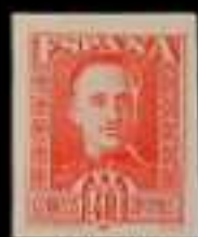
613 - 60 €