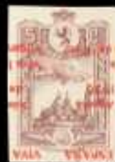
618 - 40 €