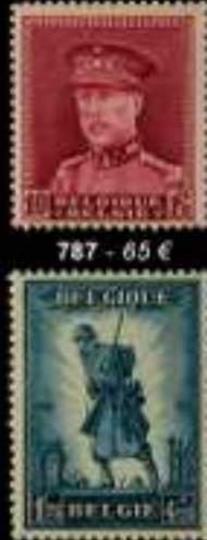
787 - 65 €