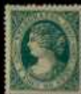
512 - 90 €