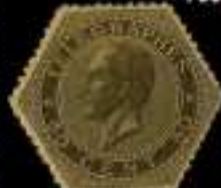
813 - 50 €