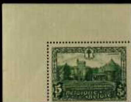
786 - 40 €