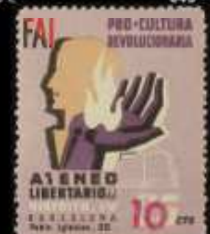
633 - 90 €