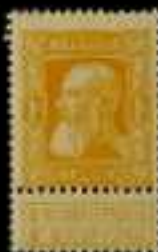
762 - 75 €