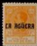
645 - 90 €