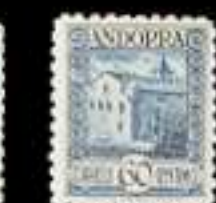
657 - 50 €