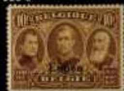
815 - 45 €