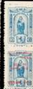
626 - 50 €